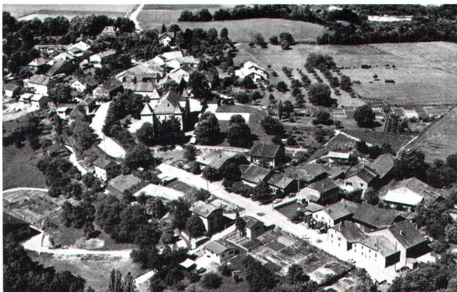
Ci-dessus: La division de l'ancien village de Dardagny en deux parties, reliées par l'église et le château, est encore visible aujourd'hui.