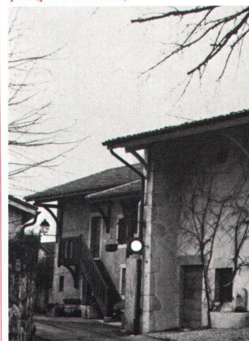
Ci-dessous: succession de maisons typiques.

Situé sur une crête, le village de Dardagny domine le site (protégé) du vallon de l'Allondon . Le déve-