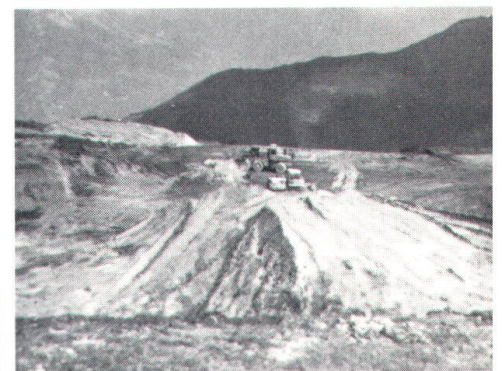
Der geplante Gebirgsflugplatz oberhalb Verbier im Modell (oben). Die widerrechtlich begonnenen Bauarbeiten sind im Moment eingestellt (unten).

und Restaurant mit einem Bauvolumen von 31 000 Kubikmetern). Eine bei der Walliser Regierung dagegen erhobene Einsprache blieb erfolglos, weshalb das Ge-