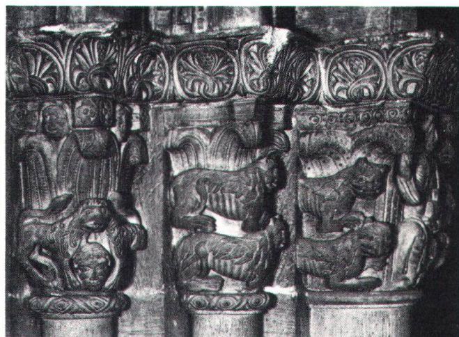
Cathédrale Saint-Pierre de Genève, chapiteaux intérieurs.