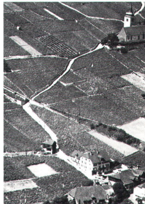
La remise à plus tard d'une double voie CFF à Gléresse ne signifie pas que la «bataille» pour ce joyau des bords du lac de Bière soit gagnée.

cachet. Un charme particulier est conféré au site par la situation unique de la vénérable église gothique , perchée au milieu des vignes à bonne distance au-dessus des maisons du village, construites en pierre d'Hauterive dorée, couvertes de tuiles plates, et étroitement serrées les unes contre les autres. Fait également partie de cet harmonieux tableau la toute proche île de St-Pierre, avec sa colline boisée, et les souvenirs historiques d'un ancien couvent clunisien et de J.-J. Rousseau. C'est à juste titre que toute la région a été inscrite en 1967 à l'inventaire des sites d'importance nationale, comme objet N° 142 (« Pied du Jura et lac de Bière »), que le Canton de Berne a choisi Gléresse parmi ses «réalisations exemplaires» de l'Année eu-