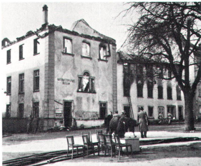
Das Naturhistorische Museum Schaffhausen, zerstört durch das irrtümliche Bombardement der Alliierten am 1. April 1944.