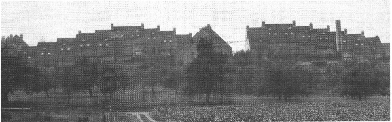
Gutes Beispiel einer von Architekt Fritz Schwarz familiengerecht gestalteten Siedlung in Dinhard ZH.

Erhöhung des Gemeindesteuerertrages ist besonders störend, wenn dadurch architektonische Greuel entstehen. Viel überzeugender sind doch die familiengerecht gestalteten frühen Gartensiedlungen , die als Reihenhäuser ein Optimum an Landverbrauch, Brennstoffeinsparung und privat gestaltbarem Lebensraum brachten. Nur wenige Bauherren realisieren noch heute – wie die Eiwog-Genossenschaft – solche gemeinschaftsfördernden Siedlungen.