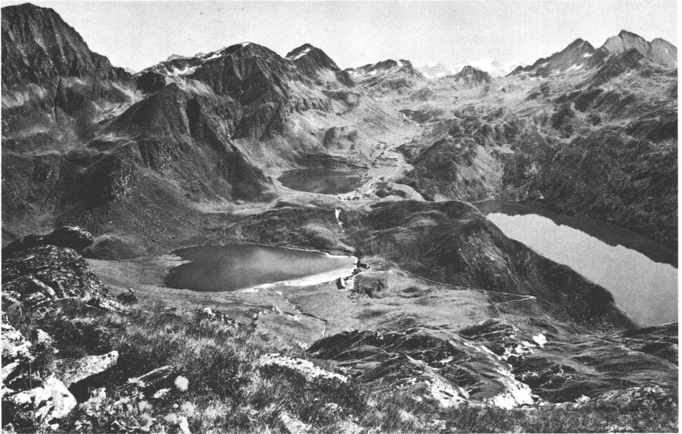
Oben: In enger Zusammenarbeit mit den politischen Instanzen von Gemeinden, Kanton Tessin und Bund bereitet der Schweizer Heimatschutz zurzeit die Errichtung eines alpinen Parks in der oberen Leventina vor. – Unten: Ein Musterbeispiel heimatschützerischer Gradlinigkeit ist das Genfer Weinbauerdorf Dardagny, welches es verstanden hat, durch eine sorgsame Bodenpolitik sich selbst zu bleiben.