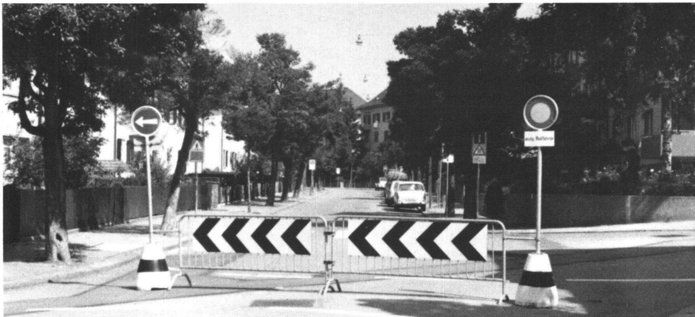
In Zürich wurde das Irchel-Quartier vom Verkehr entlastet: eine grossflächige Wohnschutzmassnahme. Wie Verkehrszählungen zeigten, nahm der Verkehr bis zu 78 Prozent ab.