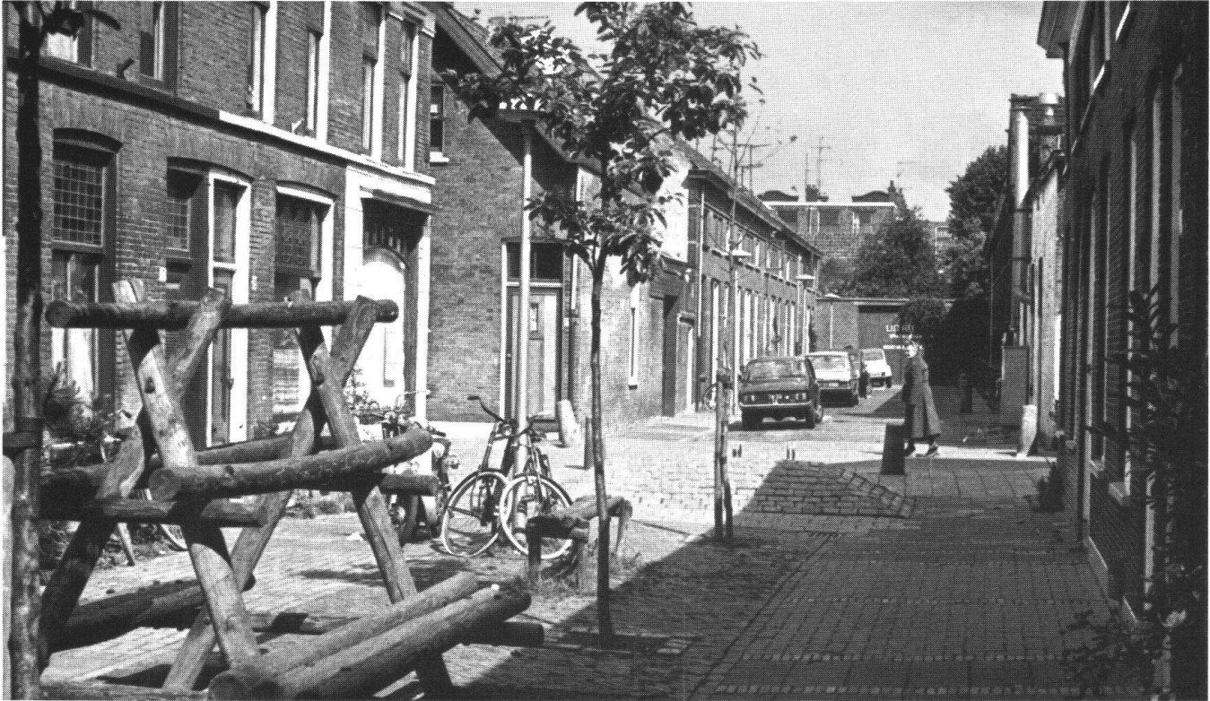
Aus dem niederländischen Delft kommt die Wohnstrassenidee: Hier wurden erstmals Strassen dem Verkehr entweicht und den spazierenden, arbeitenden und spielenden Menschen zur Verfügung gestellt (Bild Michel).