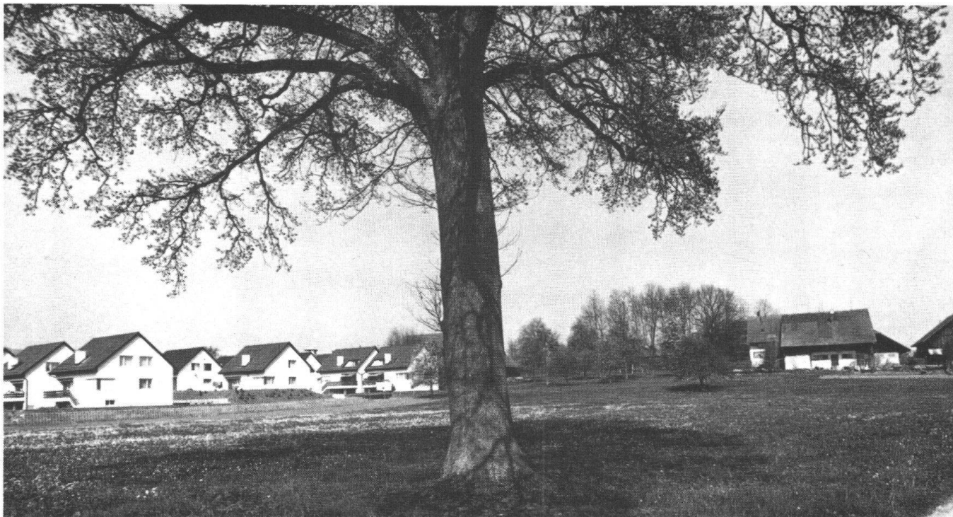
Je stärker die Bevölkerung im Einzugsgebiet der Städte wächst, desto mehr Grünraum geht verloren: Der Rand der Zürcher Oberländer Gemeinde Mönchaltorf rückt dem einst alleinstehenden Bauernhaus immer näher.

(Zürich) in einem Aufsatz. Dafür mitverantwortlich ist die splitterhafte Auftrennung der Bereiche Wohnen, Arbeiten, Spiel und Erholung: Die einzelnen Lebensbereiche haben keine Beziehung mehr untereinander.