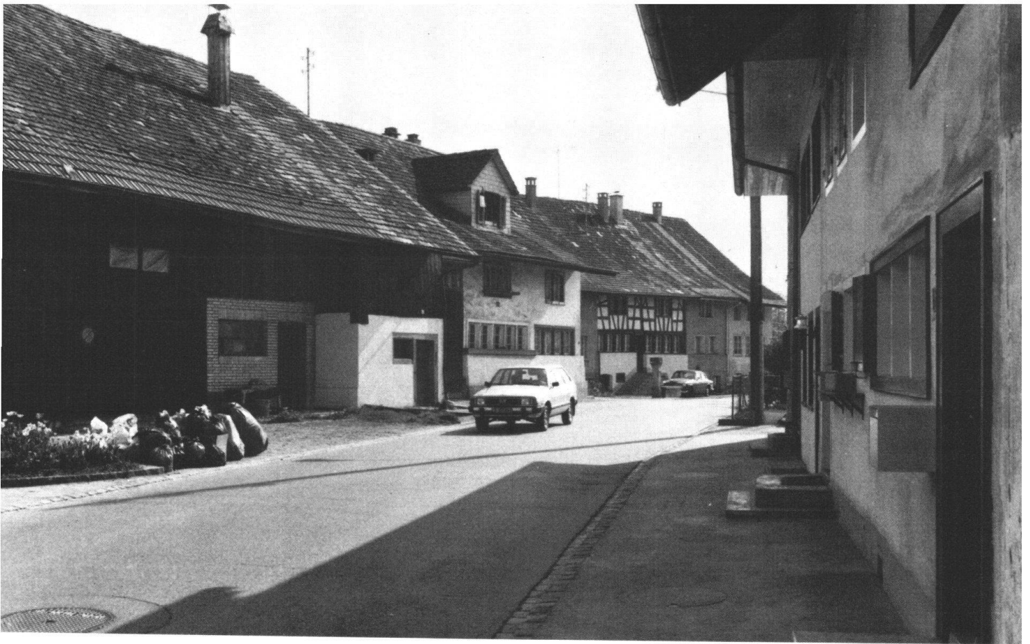
Oben: Der alte Kern von Mönchaltorf: Die zwischen den Flarzen durchführende Strasse ist eng und gefährlich. Nach dem Bau der geplanten Ortsumfahrung soll die Strasse zur Wohnstrasse umgestaltet werden. Unten: Eine neue Wohnart propagieren Siedlungen in Weilerform: In der Siedlung «Am Aabach» in Mönchaltorf gruppieren sich die Häuser um einen grossen, als Garten ausgelegten Innenhof. Zusammenleben und Nachbarschaft erhalten hiermit einen höheren Stellenwert.