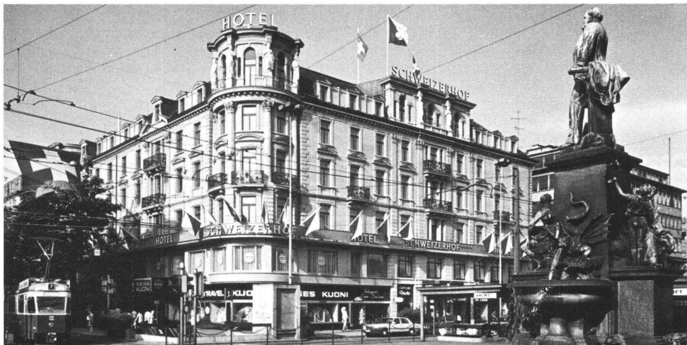
Le «Schweizerhof» de Zurich ne répond plus qu'en partie à sa destination première. Le rez-de-chaussée et le premier étage ont été aménagés en magasins et bureaux, ce qui a beaucoup altéré les anciennes façades, d'un très beau classicisme.

Autre cas: celui d'un hôtel partiellement détruit par le feu et pour lequel le Service de protection, lors du projet de reconstruction, a imposé certaines normes (surtout en ce qui concerne la toiture). La durée de la reconstruction en a été rallongée, sans que le Service de protection – comme on l'a dit plus haut – eût la possibilité de contribuer à cette perte supplémentaire. La compagnie d'assurance, de son côté, a fait valoir qu'en vertu des conditions générales d'assurance, elle n'avait pas à intervenir pour le dommage résultant du retard. Une part assez considérable des dégâts est donc restée non couverte, bien que la reconstruction, du fait d'une sous-assurance partielle, ait de toute façon mis l'hôtelier dans une situation difficile. Il est hors de doute que les contraintes de la protection des édifices impose parfois une lourde charge à l'hôtelier. Coincé entre les lois économiques et les exigences esthétiques, il opte pour une solution qui est souvent favorable au site.