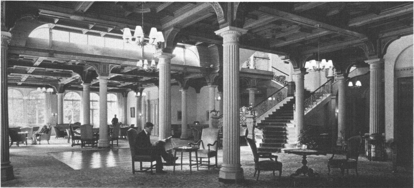
L'incomparable ambiance des anciens hôtels – comme ici au «Waldhaus» de Vulpera – sera-t-elle bientôt sacrifiée à l'uniformisation universelle pour appartenir à l'histoire?