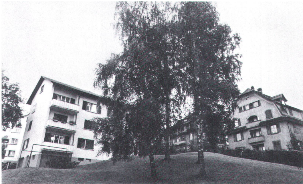
Bäume in städtischen Quartieren – hier in Luzern – sind mehr als nur grüne Lungen für die Anwohner.

Des arbres en milieu urbain – ici à Lucerne – sont plus que de simples poumons de verdure pour les habitants.