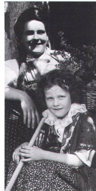
Mère et fille en costume.