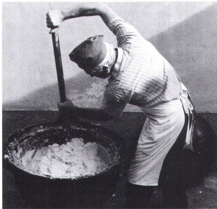
Die Polenta für den Abend wurde mit der grossen Kelle angerichtet. Il a fallu, pour brasser la polenta du soir, le grand modèle de cuiller.

tecturale et son cadre naturel. Il a permis de résister à la pression de l'agglomération de Locarno, proche de 7 km. Sa zone à bâtir, comme c'est souvent le cas dans les plans de la «première génération», a été très largement comptée; mais un bon règlement de construction, et la pratique prudente des autorités, ont jusqu'à présent limité les dégâts.