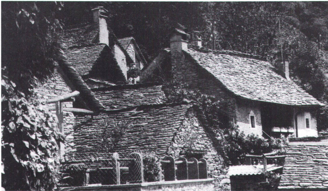
Verwinkelte Dachlandschaft aus Gneis-Platten. Toits de pierre typiquement tessinois