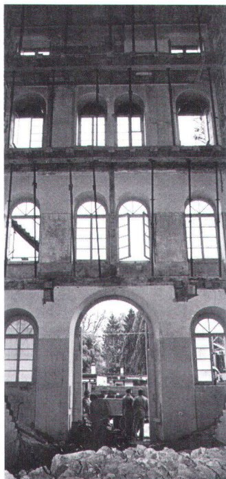
Ausgehöhlter Mittelteil der Aarauer Kaserne während des Umbaus (Bild Aargauer Hochbauamt).

Nach den Plänen des Architekten Kaspar Joseph Jeuch entstand 1847 die Aarauer Kaserne: ein an die Renaissance anlehrender Bau, der von einer «gewissen Blutarut» sei. So die Beschreibung in den «Kunstdenkmälern». Die Diskussion über die weitere Zukunft der Kaserne begann schon in den fünfziger Jahren. Wurde damals entschieden, ein Ausbau des Gebäudes komme nicht in Frage – es dränge sich ein Neubau am Stadtrand auf –, so machte der Widerstand der betroffenen Bevölkerung sowie des Naturschutzes diesen Plan zunichte. 1975 stimmte dann der Einwohnerrat der Stadt Aarau – gezwungenermassen – einer Renovation der Kaserne und der Nebengebäude zu. Aller-