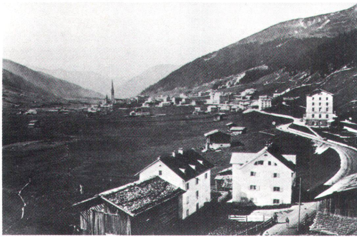
Davos-Platz vers 1880. Au premier plan, la maison Buol; à droite le Grand Hôtel Belvédère.

Davos-Platz um 1880. Im Vordergrund das Haus Buol, rechts das Grand Hotel Belvedere, erbaut 1875.