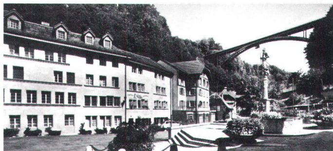
La rue des Forgerons en 1870 (en haut), et aujourd'hui après d'importants changements, spécialement dans la structure intérieure.