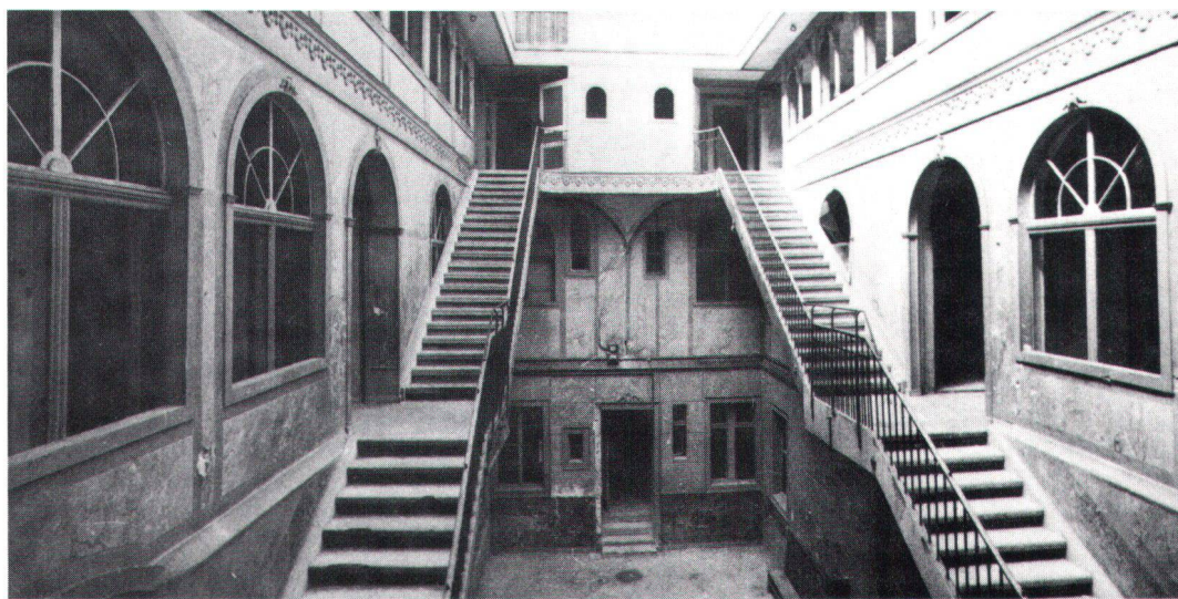
Dans la cour du Manège, on se sent presque comme dans un théâtre.

Um den verlassen Ort (das Haus gehört heute der Stadt und sie möchte es durch einen Autoparkplatz ersetzen) wieder bekannt zu machen, wurde er vom «Rettungskomitee» der Öffentlichkeit zugänglich gemacht. Feste wurden improvisiert, Konzerte, Ausstellungen. Und da für die Erhaltung Mittel benötigt werden, wurden Anteilscheine von 100 Franken aufgelegt. 30000 Franken gingen ein. 18 einheimische Architekten arbeiteten eine Studie für die Umnutzung des Gebäudes aus und wiesen nach, dass dieses wirtschaftlich tragbar bewahrt werden könne. Allein, bis heute ist es nicht gelungen, die für seine Rettung erforderlichen Gelder zusammenzubringen. Wenn sich dies nicht durch eine Gewaltanstrengung ändert, dürfte La Chaux-de-Fonds bald um eine Bastion seiner Seele ärmer sein.