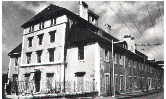
Vue extérieure de l'ancien manège de La Chaux-de-Fonds.

époque qui n'intéresse personne. Les raisons en sont simples et les bons arguments abondent: quand on a passé sa vie à défendre l'architecture d'avant l'industrialisation, qu'elle soit seigneuriale ou rurale, on retrouve toujours la noblesse des matériaux employés; quand on a aimé caresser longuement la patine des pierres, comment peut-on apprécier le plâtre des faux-marbres, le fer blanc et le toc? Le Manège n'est pas le haut-lieu de notre patriotisme. Contrairement au récent Musée international