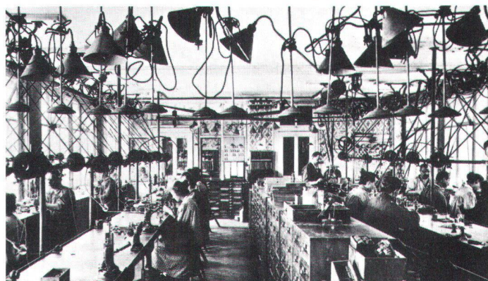
L'A. P. I collectionne aussi de la documentation photographique sur les débuts de l'industrie.

Warten aufs Museum: Maschinen im Ruhestand (API).