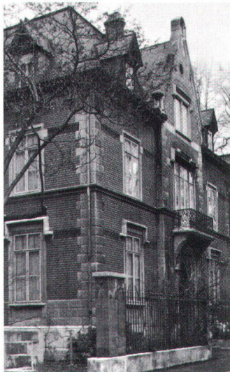
Der Souverän zog die alte Villa einem Büroneubau vor.