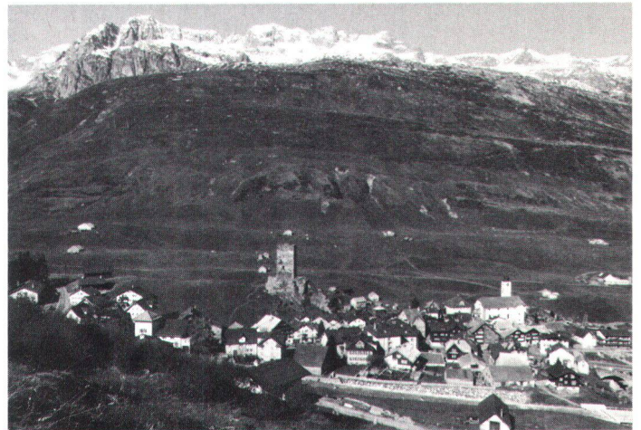
Hospental, objectif national de l'Ecu d'or 1983. Blick auf Hospental, dem Talerhauptobjekt 1983 (Bild SHS).

Votre concours permettra de constituer un fonds de 250000 fr. dont les versements serviront aux restaurations d'édifices à Hospental; le reste du produit de la vente ira à la Ligue suisse du patrimoine national et à la Ligue suisse pour la protection de la nature , pour les tâches les plus diverses à réaliser dans tout le pays. Merci de votre aide!