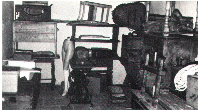
Die Schaffung von genügend Depoträumen und das Anlegen von Studiensammlungen ist in den meisten Ortsmuseen bis heute Forderung geblieben.

Ganz allgemein stehen dabei Fragen der Inventarisierung, Restaurierung, Konservierung, Sicherheit und Präsentation im Vordergrund. Erfahrungsgemäss nimmt diese Arbeit an Ort und Stelle den breitesten Platz im Aufgabenspektrum eines regionalen Museumskoordinators ein. Weitere Hilfeleistungen bei der Einzelberatung wären etwa das Aufzeigen von Wegen bei der Finanzbeschaf-