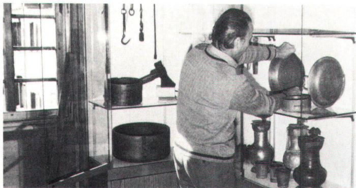
Trotz meist ehrenamtlichen Konservatoren sind die Betriebsaufwendungen für ein zeitgemäss eingerichtetes Kleinmuseum recht hoch.

Même avec des conservateurs le plus souvent bénévoles, les frais d'exploitation des petits musées de conception moderne sont très élevés.