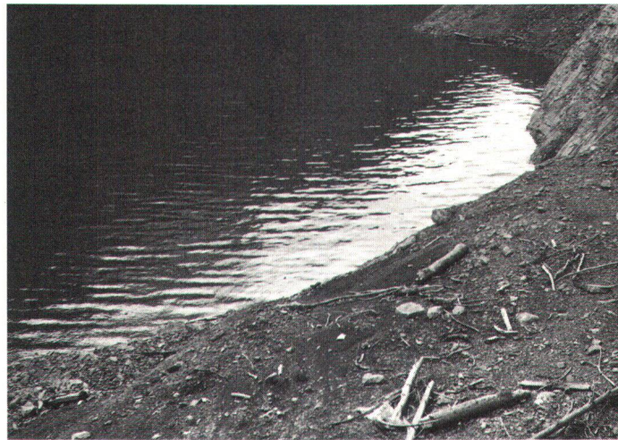
Wegen der Spiegelschwankungen kann sich an den Ufern von Speicherseen keine Vegetation bilden.

Interessen zusammen, die die Kantone als Mitträger der Elektrizitätsgesellschaften ha-ben, und andererseits mit dem Liebäugeln der Gemeinden mit den Wasserzinsen , die ih-nen durch die Wassernutzung seitens der Elektrizitätswirt-schaft zufließen. Es wäre un-gebührlich, wollte man bei-spielsweise einer Gemeinde wie Panix im Bündner Ober-land vorwerfen, dass sie bei einem jährlichen Gemeinde-steuerertrag von heute 18000 Franken daran interessiert ist, ihre kargen Mittel aufzupolie-ren durch die Wasserzinsen, die ihr im Falle eines Baues