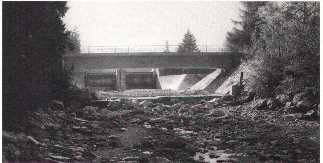
Was übrig bleibt, ist ein klägliches Rinnsal: Rheinstau bei Sedrun. Ce qui reste du Rhin après la retenue de Sedrun: un ruisseaulet.

Il est compréhensible que l'on veuille développer la production de courant indigène, d'autant plus que c'est de l'énergie «propre»: l'alarmante pollution de l'air plaide en faveur d'un rapide remplacement du pétrole. Comme, d'autre part,