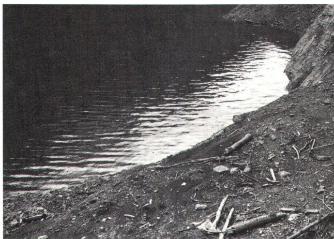
Wegen der Spiegelschwankungen kann sich an den Ufern von Speicherseen keine Vegetation bilden.

Interessen zusammen, die die Kantone als Mitträger der Elektrizitätsgesellschaften ha-ben, und andererseits mit dem Liebäugeln der Gemeinden mit den Wasserzinsen , die ih-nen durch die Wassernutzung seitens der Elektrizitätswirt-schaft zufließen. Es wäre un-gebührlich, wollte man bei-spielsweise einer Gemeinde wie Panix im Bündner Ober-land vorwerfen, dass sie bei einem jährlichen Gemeinde-steuerertrag von heute 18000 Franken daran interessiert ist, ihre kargen Mittel aufzupolie-ren durch die Wasserzinsen, die ihr im Falle eines Baues