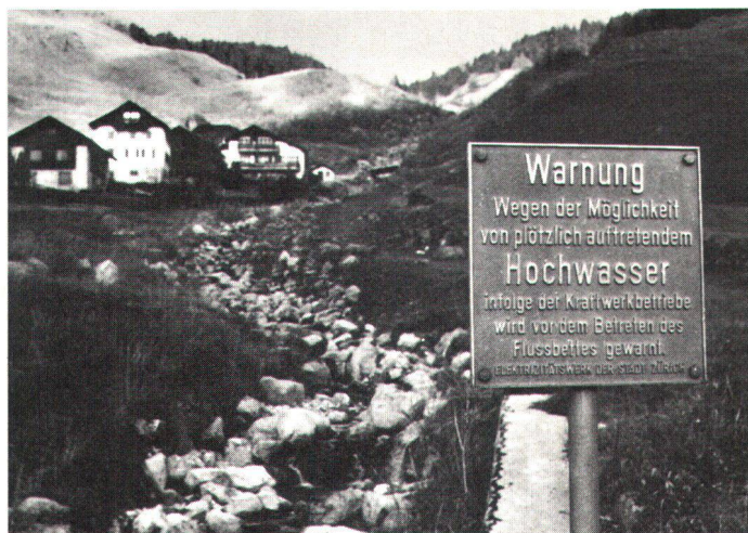
Kommentar überflüssig. Trockengelegtes Bergbachbett bei Sur im Oberhalbstein.

En raison des variations du niveau, aucune végétation ne peut prendre pied sur les bords des bassins d'accumulation.