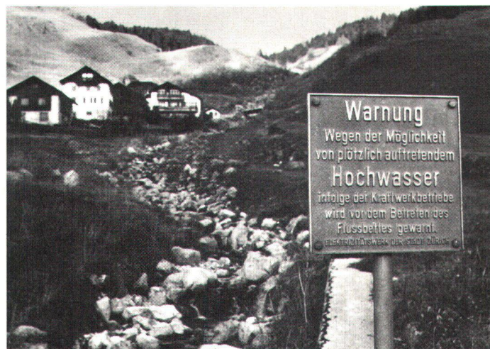
Kommentar überflüssig. Trockengelegtes Bergbachbett bei Sur im Oberhalbstein.

En raison des variations du niveau, aucune végétation ne peut prendre pied sur les bords des bassins d'accumulation.