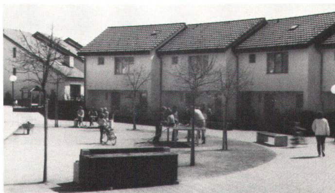
Verkehrsfreier «Dorfplatz» in der Überbauung «Lindenwiese».

Die Siedlungsform wird dabei wieder einen mehr städtischen Charakter erhalten und sich eindeutig von der Landschaft