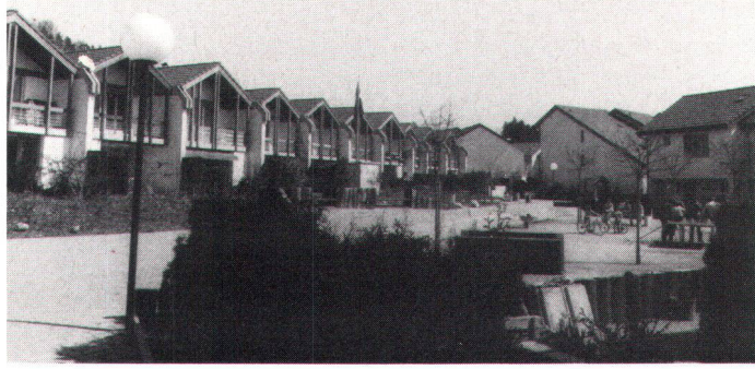
Bei dieser Hausreihe sind die Gärten auf den «Dorfplatz» ausgerichtet.

Les jardins de cette lignée de maisons s'orientent du côté de la «place du village».