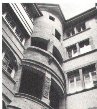
L'escalier rénové du n° 3 de la Croix-du-Marché.

début de ce siècle méritent une protection aussi bien que l'architecture considérée comme classique. Cette idée semble d'ailleurs déjà reconnue dans plusieurs cantons suisses, en particulier à Zurich. En deuxième lieu, les plans d'aménagement ne doivent plus être conçus selon le principe de la table rase. Ils doivent tenir compte du patrimoine culturel et naturel existant.