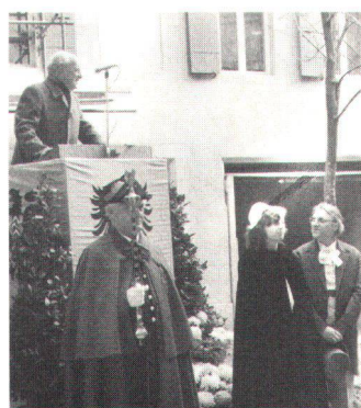
M. André Bühler, président de la Ville de Neuchâtel, remerciant de son prix la section LSP.

Motifs: la volonté politique de la Commune, depuis plusieurs années, de sauvegarder son patrimoine, concrétisée par un règlement d'urbanisme adéquat et dûment appliqué; l'ensemble des restaurations déjà réalisées, par investissements publics et privés; la création d'une zone piétonne au centre; l'intégration réussie de magasins à grande surface; la réaffectation judicieuse d'anciens bâtiments.