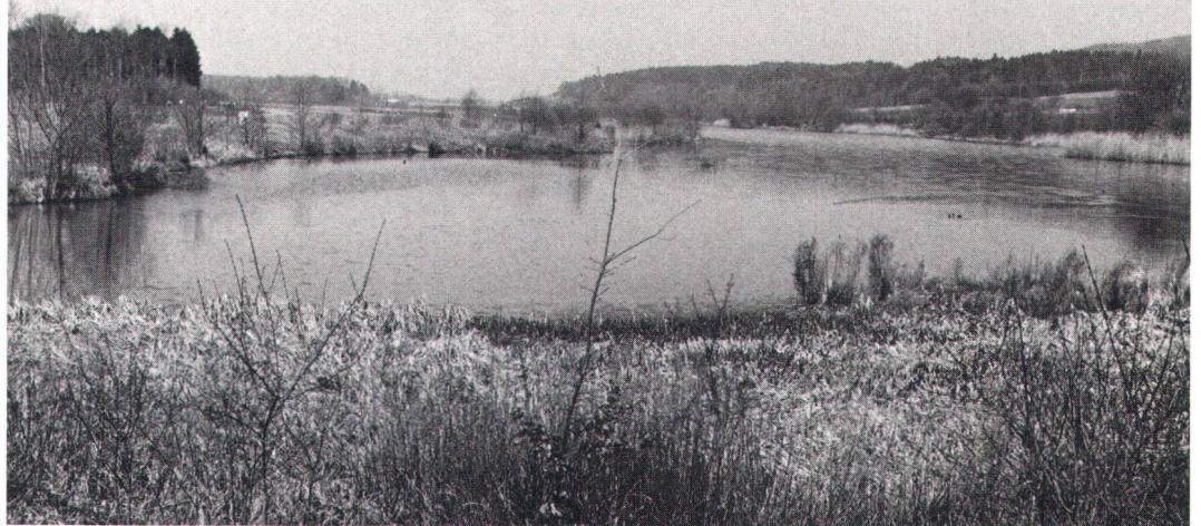
Der Flachsee – ein Rückzugsgebiet für gefährdete Brutvögel Le «Flachsee», refuge d'oiseaux menacés.