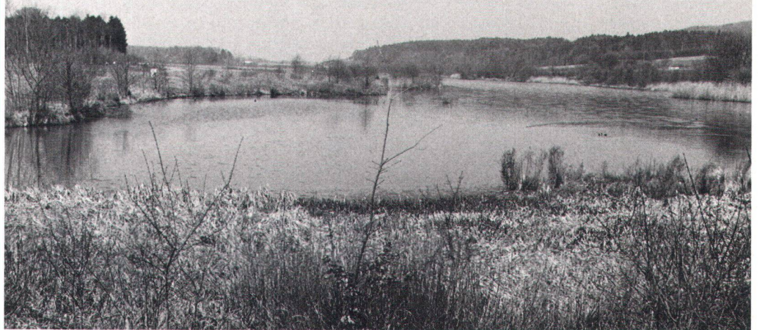
Der Flachsee – ein Rückzugsgebiet für gefährdete Brutvögel Le «Flachsee», refuge d'oiseaux menacés.