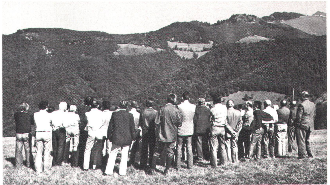
Was darf, was soll uns der Landschaftsschutz kosten? Begehung am Monte Generoso TI. Que peut, que doit nous coûter la protection du paysage? Inspection officielle au Monte-Generoso.

Sauf rares exceptions, cela ne va pas mieux dans les cantons, où les crédits vont de 30 000 fr. (!) à 1 million. Il y en a qui n'ont même pas de crédit budgétaire régulièrement prévu pour les sites, et qui lâchent de petites sommes de cas en cas. Dans la plupart d'entre eux, ces crédits représentent de 1 à