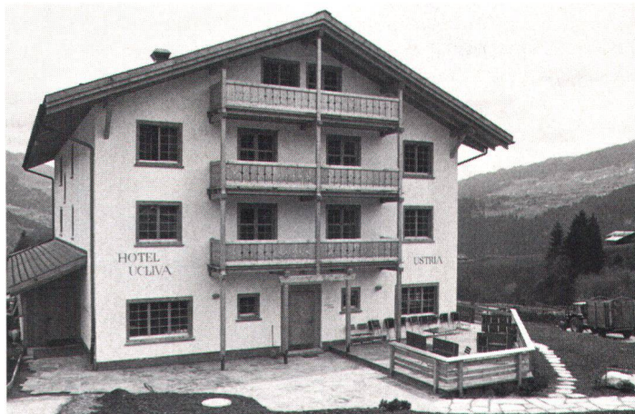
Seit bald einem Jahr erfolgreich in Betrieb ist das mit Hilfe des Schweizer Heimatschutzes auf genossenschaftlicher Basis gebaute Alternativ-Hotel «Ucliva» in Waltensburg GR

Ein Beispiel für eine grossflächige Förderung des sanften Tourismus erklärte Walter Danz, Vizepräsident der CIPRA: bereits seit 1972 können in einem Teil des bayerischen Alpenraums unseres Nachbarlands Deutschland keine harten touristischen Infrastrukturen mehr gebaut werden: in der Zone C des sogenannten Alpenplans – sie umfasst rund 1000 Quadratkilometer – sind Bergbahnen, Lifte, Ski-, Graski- und Skibobabfahrten, Rodel- und Sommerrutschbahnen, öffentliche und private Strassen sowie Flugplätze unzulässig. Diese Zone C bleibt