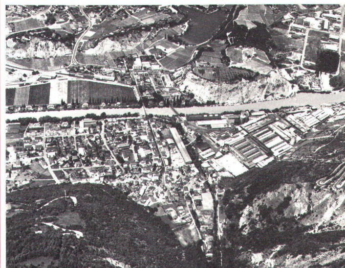
A Chippis, énergie hydraulique, industrie et constitution d'un quartier ouvrier forment un ensemble caractéristique. Augenfällig ist in Chippis der Zusammenhang zwischen Wasserenergie, Industrialisierung und der Entwicklung eines Arbeiterquartiers.

Le fil conducteur du travail présenté consiste à mettre en évidence les rapports existant entre l'industrialisation et l'urbanisation du territoire. Pour chaque cas de figure retenu, le site est tout d'abord décrit dans son état initial, les projets et leur réalisation sont ensuite commentés, de même que leurs conséquences sur l'urbanisation et le développement urbain. Une abondante iconographie illustre le tout. L'exposition sera présentée pour la première fois aux mois de décembre 1984 et janvier 1985 à Genève, au Centre d'art contemporain. Elle deviendra ensuite itinérante et devrait en tous cas être montrée dans les sept cantons directement concernés de Suisse occidentale. Des présentations à l'étranger sont à l'étude. (Suite page 18)