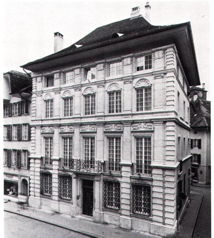
Bauberatung will nicht nur historische Bauten erhalten...