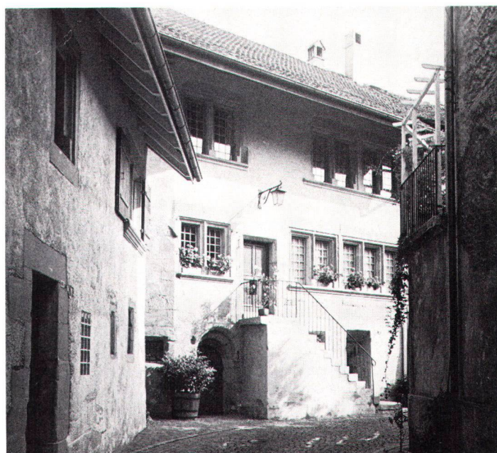
Renoviertes gotisches Wohnhaus im Zentrum von Avenches

Maison gothique restaurée dans le centre d'Avenches.