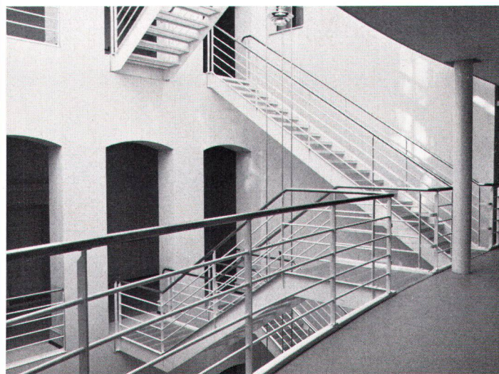
Erhaltene und ergänzte Baustrukturen im Innern des Amthauses dienen der Orientierung

Façade de l'«Amthaus» de Berne: bon résultat malgré les buts discutables du concours.