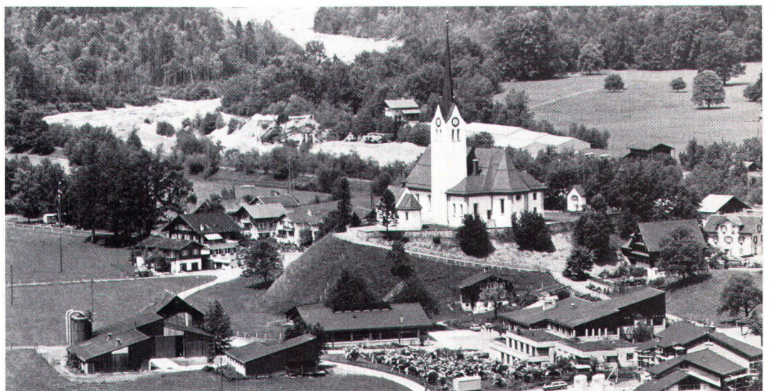
Projekt-Modell und ausgeführte Neubauten der Landw. Schule Giswil OW, die sich feingliedrig der dominierenden Kirche unterordnen und mit dieser eine spannungsvolle Einheit bilden

Maquette (en haut) et bâtiments achevés de l'Ecole d'agriculture de Giswil OW, qui gardent leur rang par rapport à l'église et forment avec elle une remarquable unité.