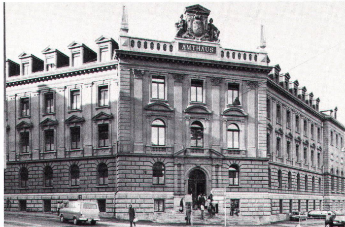
Fassade Amthaus Bern: Gutes Resultat trotz fragwürdiger Zielsetzung des Wettbewerbes (Bild Atelier 5)

«Solchen Architekten (insbesondere jungen, tüchtigen Künstlern), dem Publikum und nicht zuletzt ihrer guten Sache, glaubt die Vereinigung für Heimatschutz einen Dienst zu erweisen, wenn sie es unternimmt, für bestimmte Bauaufgaben Wettbewerbe auszuschreiben und dann durch Veröffentlichungen der besten Entwürfe deren Verfassern die Wege zu ebnen.» So begründete der Schweizer Heimatschutz 1908 seinen Wettbewerb für einfache schweizerische Wohnhäuser. Und wie stellt er sich heute zur Wettbewerbsidee?