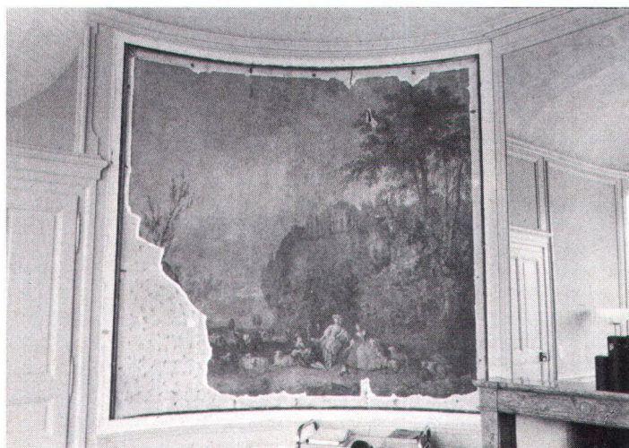
Panneau peint, dans le salon ovale du 1 er étage. Wandgemälde im ovalen Salon des ersten Stockes.

La demeure de Champ-Pittet est restée une œuvre isolée, sans influence sur l'architecture d'alentour. Peut-être un architecte anglais en a-t-il fait les plans; mais, par la sobriété et la commodité de sa configuration, elle est en tout cas à l'image du général Haldimand, qui semble avoir voulu «manifester dans la pierre ce que furent sa carrière et sa personne». C.-P. Bodinier