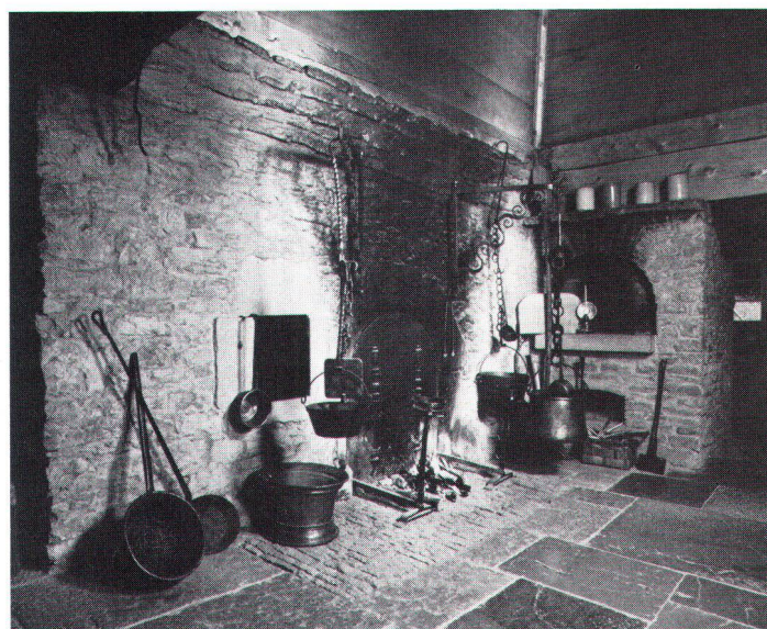
Foyer et four à pain de la maison jurassienne. Feuerstelle mit Backofen im jurassischen Haus

Au cours des travaux l' imagination fut toujours solidement tenue en bride. Une information précise obtenue grâce à des contacts et à des visites fréquentes permit une reconstruction fidèle. Les entreprises engagées ont travaillé avec un soin exemplaire. Toutes les fois que ce fut possible ou eut