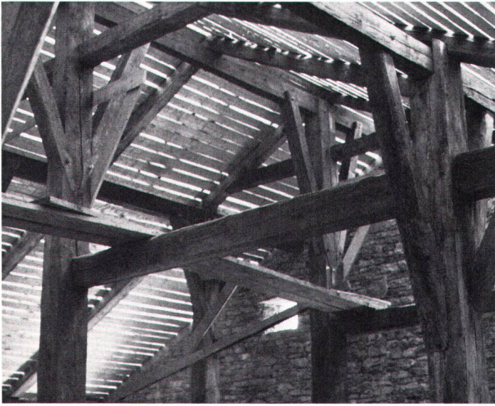
L'armature intérieure de la maison polyvalente de La Chaux-de-Fonds est entièrement en bois.

Innenausbau und Tragkonstruktion des Vielzweckhauses von La Chaux-de-Fonds bestehen aus Holz