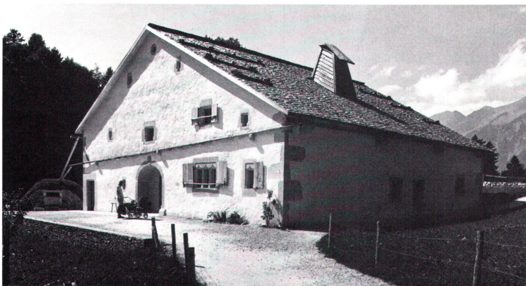
... et après sa reconstitution dans l'état originel. ... und nach dem Wiederaufbau im ursprünglichen Zustand

comme des mâts pour assurer la robustesse de la bâtisse, non sans déterminer de surcroît l'ampleur des pans de toit, caractéristique importante sinon essentielle de notre ferme. Trois rangs de colonnes orientées dans la direction du faîte et partant du sol même en verrouillent puissamment l'armature assurée par traverses et bras de force. Dès lors le squelette de la maison se dresse comme une cage de bois tenant debout par elle-même. Il ne reste plus alors qu'à la cou-