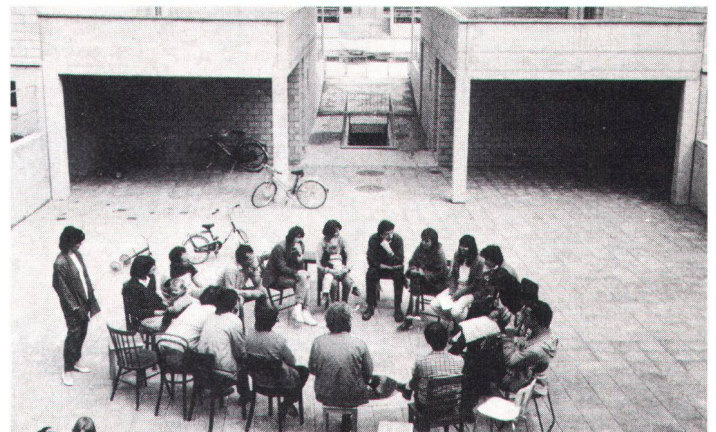
Strapazierte Gemeinschaft auf dem Siedlungsplatz?

werden, so ist nicht jene strapazierte Einfachheit gemeint, die in Einfallslosigkeit, Billigkeit, ja ordinärster Schabigheit mündet. Wir meinen auch nicht jene Einfachheit, die sich als Schäferspiel entpuppt und in einer modernistischen Cha-