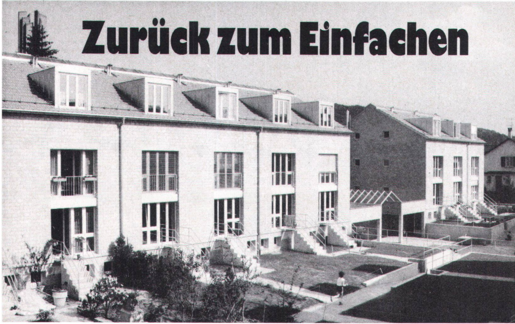
Klare Aussage durch einfache Materialien Des matériaux simples donnent une expression nette.

Unser architektonisches Erbe intakt zu erhalten, ist eines der Hauptziele des Schweizer Heimatschutzes. Seit jeher befasst er sich aber auch mit der Gegenwartsarchitektur. Das soll sich fortan regelmässig in dieser Zeitschrift niederschlagen. Dem dient unsere neue Rubrik: «Bauen heute». Der erste Beitrag befasst sich nach einer allgemeinen Einführung mit einer vom Basler Heimatschutz ausgezeichneten neuen Siedlung in Riehen.