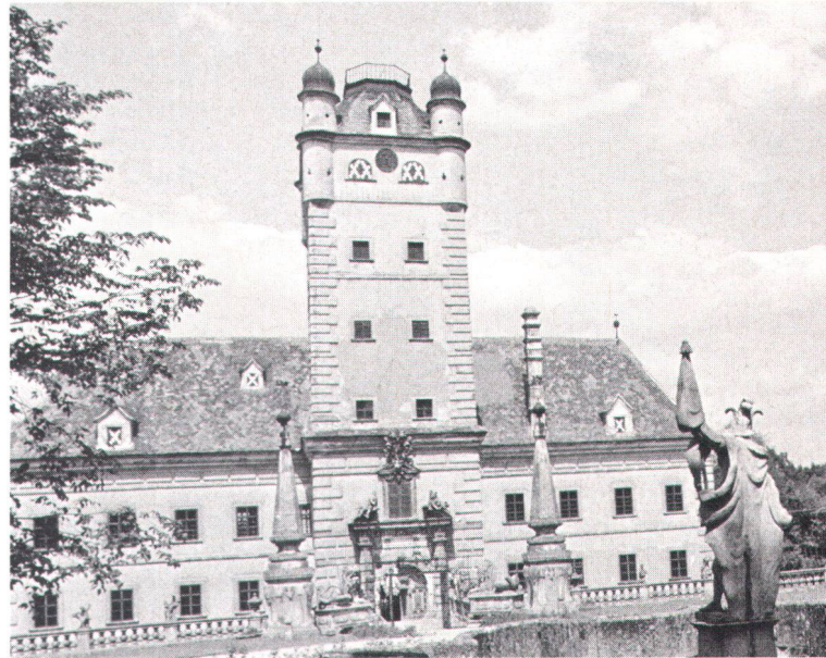
Schloss Greillenstein in Niederösterreich wird von seinem Privatbesitzer unter grossem Einsatz als Museum geführt

Eine schwerwiegende Besonderheit des inklusive der Strafbestimmungen 20 Paragraphen umfassenden Denkmalchutzgesetzes stellt der Paragraph 2 dar, wonach automatisch jedes Gebäude im öffentlichen oder kirchlichen Besitz so lange als Denkmal anzusehen ist, als das Bundesdenkmalamt nicht auf Antrag des Eigentümers das Gegenteil