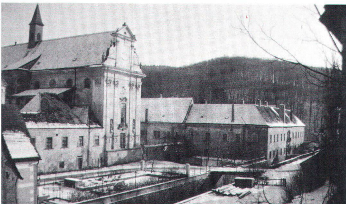
In der Kartause Mauerbach ist das Dokumentations- und Ausbildungszentrum des Bundesdenkmalamtes untergebracht

En plus de la législation centrale, les pouvoirs publics des «Länder» et des communes jouent un rôle complémentaire important. Les uns et les autres peuvent promulguer leurs propres arrêtés et ordonnances