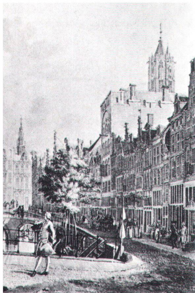
Le comblement des canaux (ici celui de l'Oude à Utrecht, d'après Jan de Beyer, 1753) a été aux Pays-Bas un puissant déclencheur du mouvement de protection des sites.

Dem Minister steht ein unabhängiges Beratungsgremium zur Seite: der Denkmalrat (Monumentenraad). Er hat fünf Abteilungen: die Staatliche Kommission für Denkmalpflege (Rijkscommissie voor de Monumentenzorg), das Staatliche Amt für Archäologie (Rijkscommissie voor het Oudheidkundig Bodemonderzoek), die Staatliche Kommission für Kunsttopographie (Rijkscommissie voor de Monumentenbeschrijving), die Staatliche Kommission zum Schutze von Denkmälern gegen Katastrophen und Kriegseinwirkungen (Rijkscommissie voor de Bescherming van Monumenten tegen Rampen en Oorlogsgevaaren) und die Staatliche Kommission für Museen (Rijkscommissie voor de Musea). Ein grosser Teil der denkmalpflegerischen Aufgaben ist dem Staatlichen Amt für Denkmalpflege übertragen (Adresse: