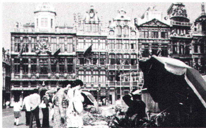
Après des années d'intense circulation motorisée, la célèbre Grand' Place de Bruxelles a été rendue aux piétons Nach jahrelanger Autoplage wieder dem Fussgänger zugänglich gemacht: die Grand' Place in Brüssel.

Cet inventaire ponctuel est complété par d'importantes publications . Le premier volume des « Ensembles ruraux de Wallonie » concerne la Lorraine belge; d'autres études sont en cours. L'objectif est de mettre à la disposition des autorités, comme des habitants, un instrument permettant de mieux maîtriser les changements et de prendre conscience des menaces de destruction qui pèsent sur certains villages. L'« Atlas du patrimoine architectural des centres anciens » est le fruit d'une collaboration entre l'Aménagement du territoire et le Patrimoine culturel. L'objectif visé est d'inciter à la recherche de solutions contemporaines et de qualité. Claude Bodinier