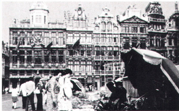
Après des années d'intense circulation motorisée, la célèbre Grand' Place de Bruxelles a été rendue aux piétons Nach jahrelanger Autoplage wieder dem Fussgänger zugänglich gemacht: die Grand' Place in Brüssel.

Cet inventaire ponctuel est complété par d'importantes publications . Le premier volume des « Ensembles ruraux de Wallonie » concerne la Lorraine belge; d'autres études sont en cours. L'objectif est de mettre à la disposition des autorités, comme des habitants, un instrument permettant de mieux maîtriser les changements et de prendre conscience des menaces de destruction qui pèsent sur certains villages. L'« Atlas du patrimoine architectural des centres anciens » est le fruit d'une collaboration entre l'Aménagement du territoire et le Patrimoine culturel. L'objectif visé est d'inciter à la recherche de solutions contemporaines et de qualité. Claude Bodinier