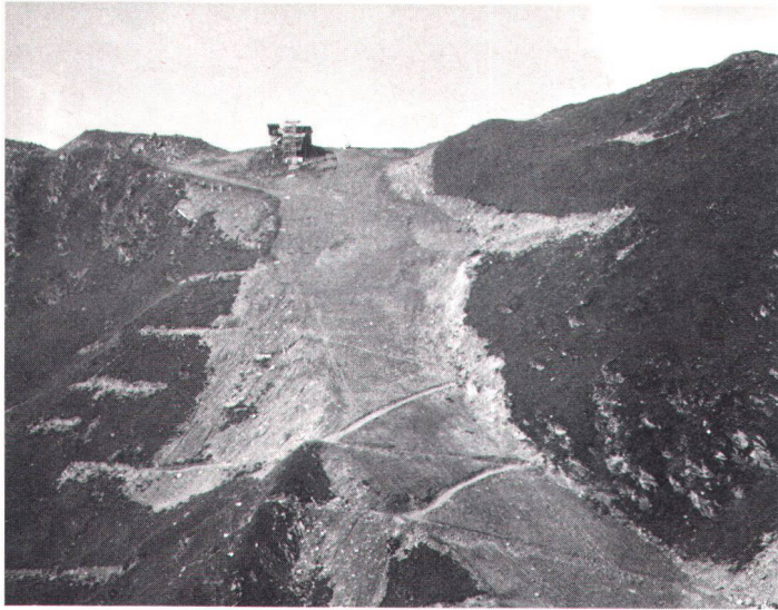
D'aussi brutaux aplanissements pour pistes de ski font d'inguérissables blessures au paysage Solch brutale Skipistenplanierungen schlagen unheilbare Wunden in die Landschaft.

korrekturen und Pistenplanierungen, welche die Landschaft schon jetzt oft brutal verletzen und den Unwillen der Sommertouristen hervorrufen.