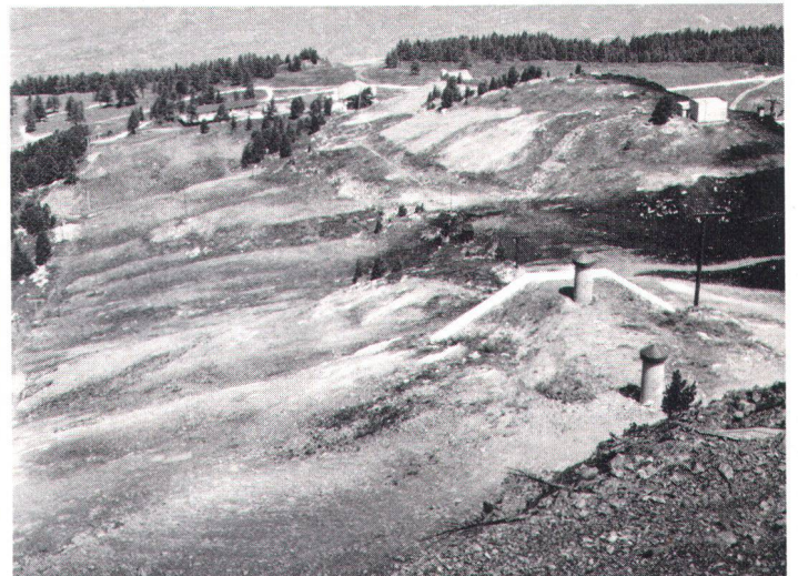
Les érosions dues aux pistes de ski sont un scandale pour les touristes de l'été.

Willy Loretan, conseiller national, président de la Fondation suisse pour la protection du paysage