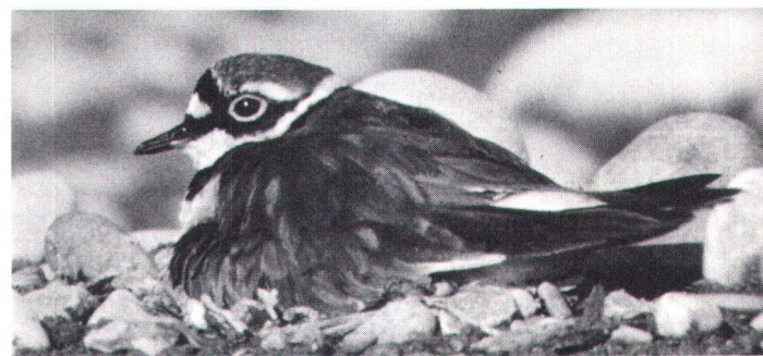
Le Petit Gravelot – un de ces habitants qui se font rares