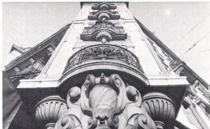
Rond-point de la Jonction, à Genève, fronton décoré dans le style «art nouveau» et dû à Jacques van Leisen (photo du Service des monuments et des sites)

Zehn Kunstgeschichtler der Heimatschutz-Sektion Genf wollten wissen, was es mit dem Verruf dieser Zeit auf sich hat. Quartierweise, Strasse um Strasse haben sie alle Gebäude erfasst, die «rehabilitiert» zu werden verdienen, um nach einem heiklen Auswahlverfahren dem Publikum 12 ansprechende Rundgänge durch das Genf des 19. Jahrhunderts vorschlagen zu können. Das Buch richtet sich an alle, die die Rhonestadt lieben, besonders aber an alle Genfer, die hier eine zusätzliche Begründung erhalten, ihre Stadt zu schätzen und sich für ihre Erhaltung einzusetzen.