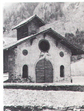
Durch den Heimatschutz gerettet: Das Spritzenhaus im Dornhaus Diesbach vor (oben) und nach (unten) der Restaurierung

Das Messmerhaus in Ennenda wurde – aufgrund von Jahreszahlen an der Fassade zu schliessen im Jahre 1700 erbaut – im Jahre 1760 neu bemalt. Aus der ersten Bauepoche stammen wohl die geflammten Läden, aus dem Jahre 1760 die barocke Ladenbemalung. Erstere zieren heute den Hauptbau, letztere den Nebenbau. Auf der Firstpfette