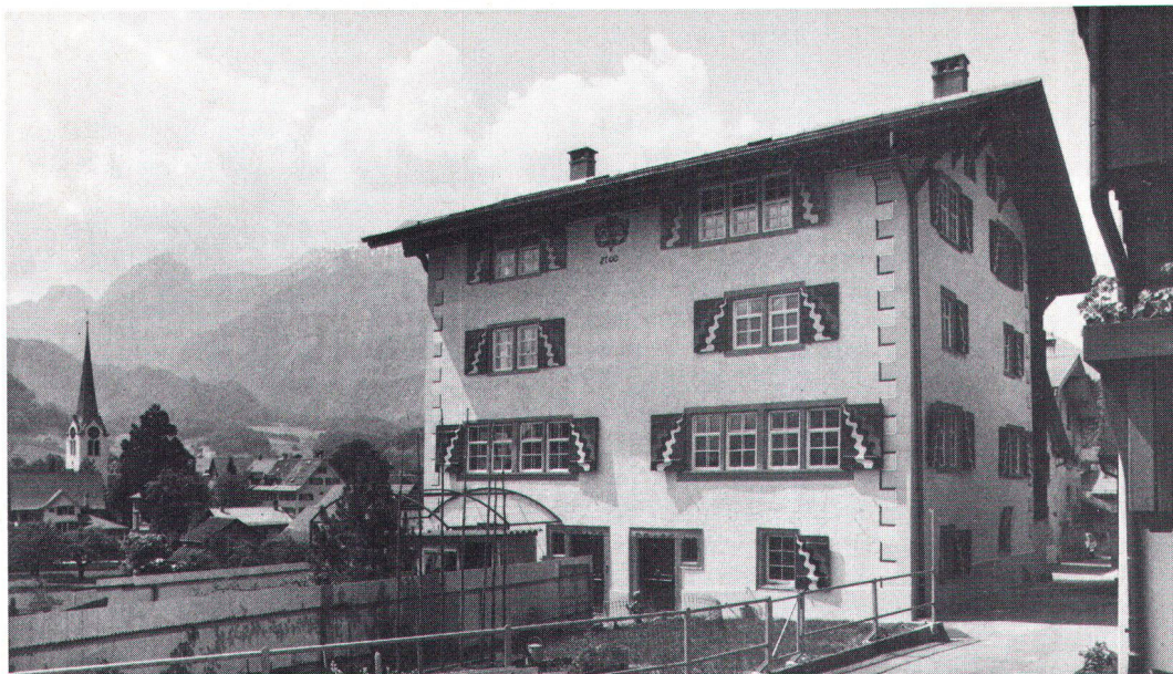
Messmerhaus in Ennenda mit Blick zum Dorfzentrum La maison Messmer, à Ennenda, et coup d'œil sur le centre du village.

• Studien auf der Basis der Inventare mit möglichst umfassender Betrachtungsweise, die auch grössere stadträumliche Zusammenhänge erfasst. Der Aussenraum mit all seinen Implikationen steht hier im Vordergrund, weniger die nutzungsorientierte Planung.