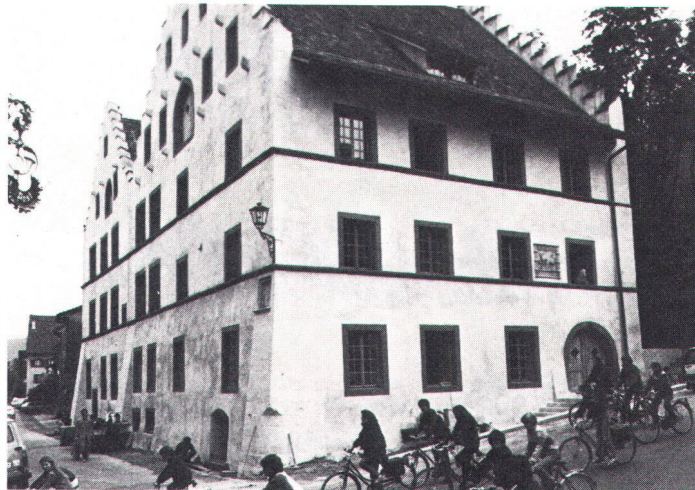
Das renovierte Amtshaus von Kaiserstuhl als Schullager (Archivbild)

Rénovée, la maison de commune de Kaiserstuhl abrite maintenant des camps scolaires.