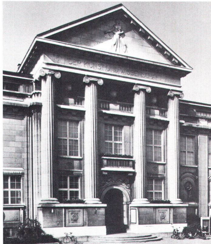
Giebelfront des Museums- und Bibliotheksgebäudes Winterthur, 1913–16.

Grosse Bedeutung massen die Architekten der Innenausstattung zu. Die Haupträume des Museums- und Bibliotheksge-