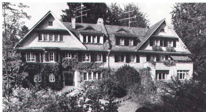
Südfront des Doppelwohnhauses Rittmeyer/Wolfer-Sulzer in Winterthur von 1908.

Façade sud de la maison jumelée Rittmeyer/Wolfer-Sulzer à Winterthur (1908).