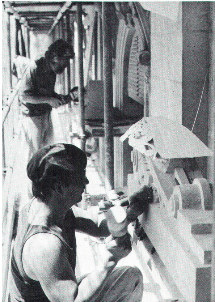
Pour restaurer une pierre dégradée, il faut des tailleurs et sculpteurs très compétents.

Kopien (links) sollten die Ausnahme, der Schutz von Originalen (rechts) muss die Regel bilden.