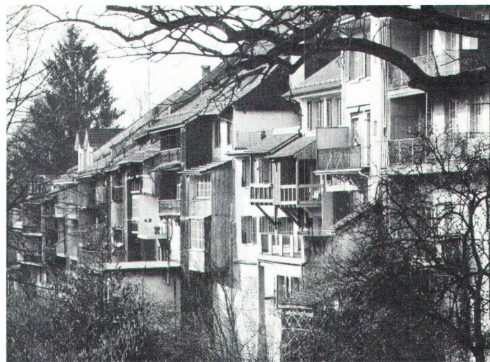
Blick hinter die Altstadtkulisse. Un coin de la vieille ville vue de derrière.