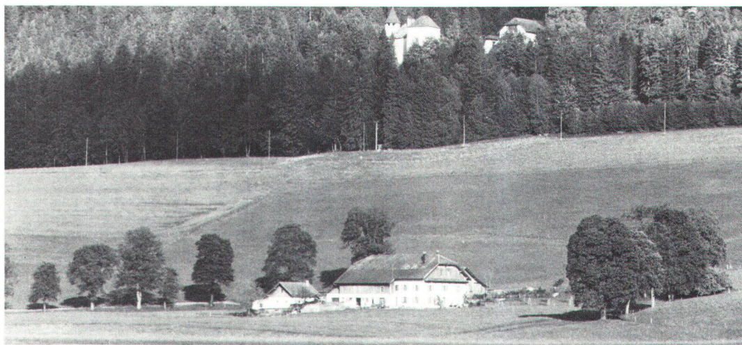
Du fond de la vallée, vue sur le château bâti par les comtes de Neuchâtel au-dessus de Môtiers.

Letztes grosses Ereignis im Val-de-Travers war, sieht man von der im Jahre 1867 errichteten Textilmaschinenfabrik Dubied in Couvet ab, der Durchmarsch der 80000köpfigen Bourbaki-Armee im Februar 1871. Kirchen, Schulen, Häuser, Ställe und Scheunen verwandelten sich in Schlafräume, um die völlig erschöpften, erkrankten und ausgehungerten Russen aufzunehmen. Indem sie dieser Armee von Flüchtlingen Nahrungsmittel und warme Kleider abgaben, zeigten sich die Einheimischen jeden Lobes würdig.