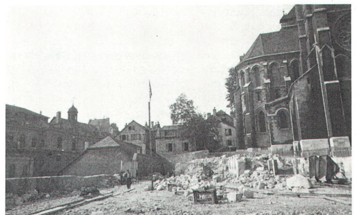
En 1940, un tiers de la vieille ville devait être démoli (photo d'archive).