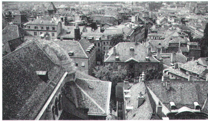
Le fruit d'un bel effort: la vieille ville est maintenant protégée.