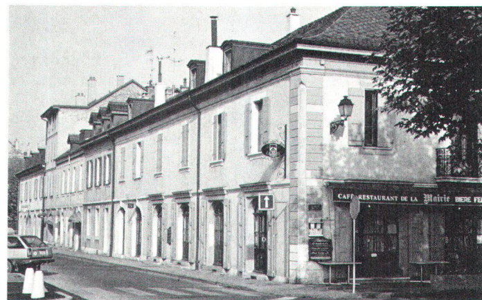
Le Vieux-Carouge – ici la rue J. Dalphin – renaît lui aussi (photo Service des monuments et des sites, Genève).