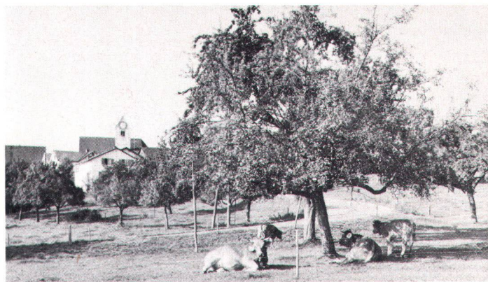
In den letzten Jahren sind viele Landwirte dazu übergegangen, wieder hochstämmige Obstbäume anzupflanzen. Ces dernières années, de nombreux agriculteurs se sont remis à planter de vrais arbres fruitiers, hauts sur pied.

Konkret bedeutet das, dass von einer längerfristig ausgelegten Agrarpolitik in erster Linie bessere Voraussetzungen für eine markt- und umweltgerechte Landwirtschaft verlangt werden. Dies erfordert auch die Bereitschaft, mit Kritikern der heutigen Agrarpolitik zu verhandeln. Diese grundsätzlichen Forderungen werden mit der recht hohen Bereitschaft bekräftigt, auch persönlich möglichst umweltschonende Produktionsverfahren anzuwenden. Immer-