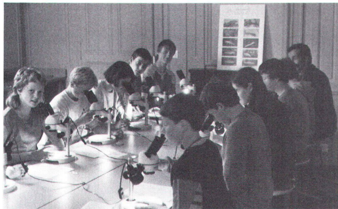
Ce sont surtout les camps et les semaines de vacances extra-scolaires qui se prêtent à l'enseignement de la protection du patrimoine. Vor allem Lager und ausserschulische Ferienwochen böten sich für heimatschützerische Kursthemen an.

L'école n'a heureusement pas le monopole de la formation. D'autres organismes, d'autres institutions mettent leurs compétences et leur dévouement au service du public en vue de l'instruction et de l'épanouissement de chacun. Les enfants et adolescents, soucieux d'échapper au carcan scolaire, ne sont pas des consommateurs volontaires de cours particuliers, du soir ou de vacances. En revanche, ils s'associent volontiers aux activités des groupements proposant diverses filières d'occupations extra-scolaires. Les groupements de jeunesse, structurés comme les éclaireurs, ou plus discrets dans leur encadrement, offrent aux jeunes des contacts, travaux et excursions dont les thèmes peuvent rencontrer nos intérêts de protecteurs du patrimoine.