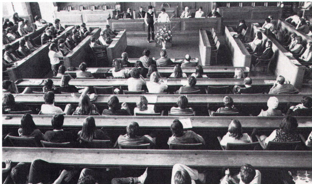
Qui a le souci de son patrimoine doit s'en préoccuper de bonne heure, comme le montre cette réunion de jeunes organisée par la LSP.

Von der Redaktion gekürzte Fassung des am 5. Februar 1988 auf Schloss Hünigen gehaltenen Vortrages.