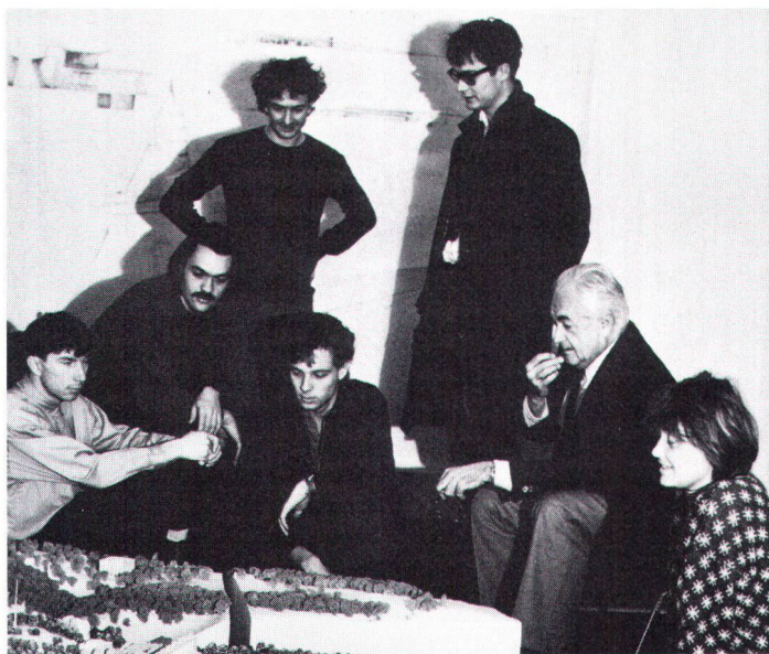
In Zukunft will die ETH nicht nur Normal- und Nachdiplomstudien u. a. für werdende Architekten und Planer anbieten, sondern auch Weiterbildungskurse für bereits Berufstätige. Désormais, le Poly veut offrir, en plus des études ordinaires et des possibilités de diplômes complémentaires (notamment pour de futurs architectes et planistes) des cours de formation continue pour praticiens.

Der Vorstand des Verbandes der Studierenden an der ETH Zürich (VSETH) hat über die Weihnachtstage 1985 den Katalog der Lehrveranstaltungen der ETHZ nach Veranstaltungen durchsucht, die sich in irgendeiner Form mit Umweltschutz und Ökologie befassen. Unter anderem wollte sich der VSETH damit einen Überblick verschaffen, welche Themen überhaupt abgedeckt sind. Das Ergebnis ist beeindruckend; weit über 100 solche Veranstaltungen werden angeboten. Dazu kommt im Schosse der Abteilung für Naturwissenschaften seit dem letzten Herbst das neue Studium « Umweltnaturwissenschaften », das 114 Neueintretende angezogen hat. Im nächsten Herbst wird die Abteilung für Vermessung und Kulturingenieurwesen das Studium des « Umweltingenieurs » anbieten, so dass wir heute eine und in nächster Zukunft zwei Ausbildungsmöglichkeiten haben werden, die sich