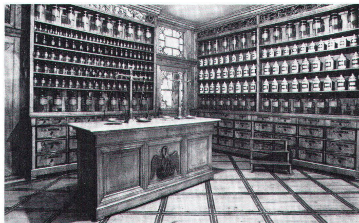
Un cas unique: l'ancienne pharmacie bruntrutaine. Ein «Unikum»: die alte Pruntruter Apotheke.

Le processus de restauration progressive de Porrentruy est loin d'être arrivé à son terme. Il s'agit d'une œuvre de longue haleine qui devra se poursuivre les prochaines années. Le travail s'exercera notamment dans les directions suivantes: ● piétonnisation durable d'un secteur délimité de la vieille ville; ● solution aux problèmes de parcage en vieille ville par la création de parkings périphériques; ● suite de l' aménagement et de l'équipement de places publiques (place Blarer de Wartensee, place de la Chaumont, placette des Capucins); ● extension du parc des Prés de l'Etang jusqu'à la rue Joseph-Trouillat; ● affinement de la réglementation en matière d'urbanisme; ● poursuite de l' inventaire systématique; ● effort accru d' information auprès de la population, avec notamment la réalisation en 1988 ou 1989 d'une exposition sur «Porrentruy 1900» destinée à sensibiliser la population à l'importance du patrimoine du tournant du siècle; ● développement du réseau de cheminements piétonniers; ● réalisation au centre-ville de nouveaux pôles de fixation (bâtiment de la Chaumont, rez-de-chaussée de l'Hôtel des Halles, ...); ● développement d'une étude relative à la création de transports urbains en ville de Porrentruy. R. Salvadé/M. Boil