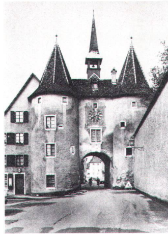
La porte de France. Die «Porte de France».

De ce Porrentruy, capitale d'un Etat ecclésiastique, il reste malgré la Révolution et plus d'un siècle de libéralisme musclé, de nombreux signes extérieurs : ensemble du couvent / collège des Jésuites institué comme bastion de la Contre-Réforme, couvent des Ursulines; église paroissiale gothique de Saint-Pierre, église de Saint-Germain, étrangement située hors des murs depuis le moyen-âge, temple réformé