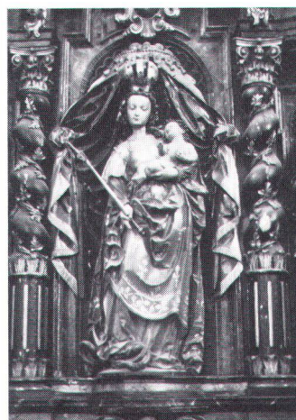
«Madone à l'Enfant», de Jean-François Reyff (1645). «Madone à l'Enfant» von Jean-François Reyff (1645)