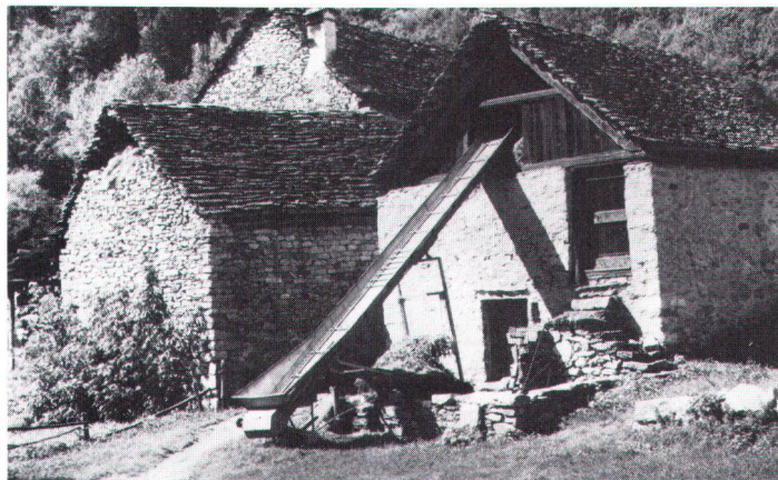
La technique – ici, une bande transporteuse provisoirement installée pour le foin – peut sauvegarder la substance architecturale.

Technik – in diesem Fall ein temporär eingesetztes Heuförderband – kann Bausubstanz schonen