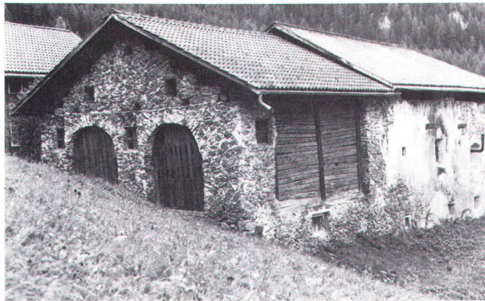
En Basse-Engadine: dépendance au toit rénové, mais abandonnée depuis des décennies.

S'il y a conflit entre utilisation agricole et sauvegarde de la substance architecturale, il faut, d'une part, que les exigences d'ordre agricole soient davantage équilibrées par la prise en considération des valeurs culturelles; et il faut, d'autre part, que la défense