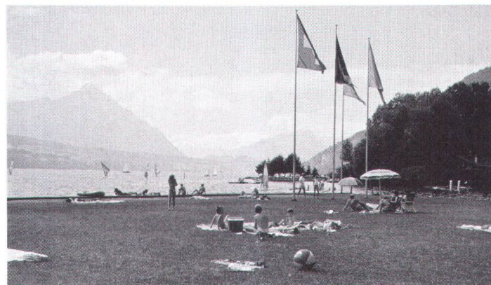
... les piscines font partie des installations les plus économes de terrain (ici au bord du lac de Thoune).

... gehören Schwimmbäder zu den bodenschonendsten Anlagen (hier am Thunersee BE)