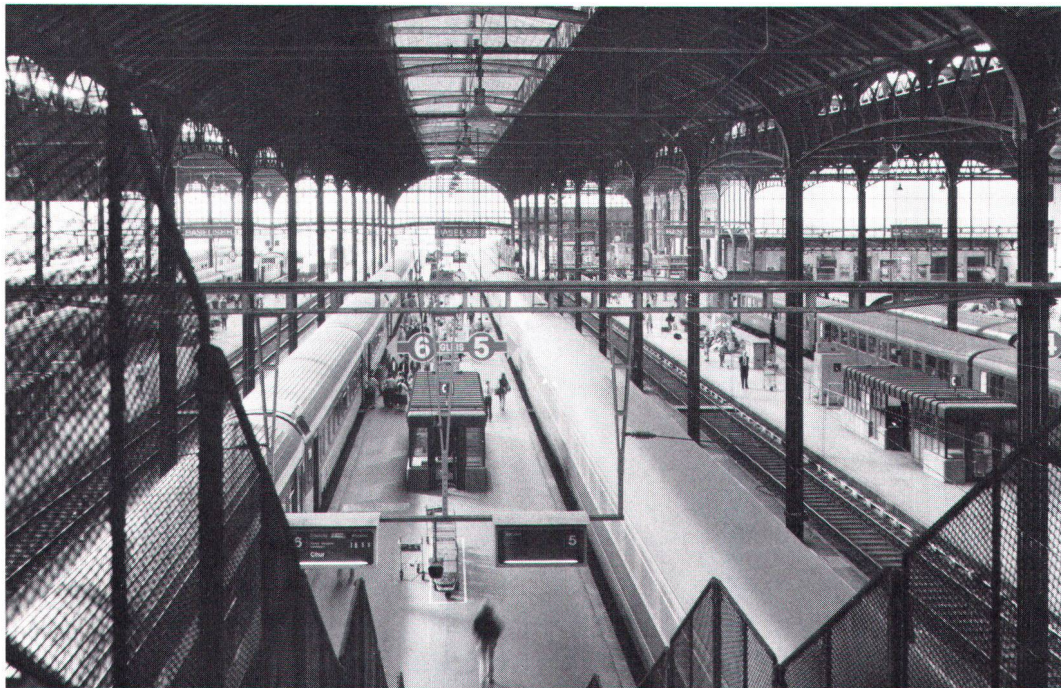
Blick in die Basler Bahnhofhalle mit den geschützten Perrondächern. Coup d'œil dans la halle de la gare de Bâle, avec les toitures (protégées) des quais.

La réalisation du plan de 1986 est une vraie chance pour l'urbanisme à Bâle: la gare CFF sera mieux intégrée à la cité, ses alentours seront mis en valeur, et les intéressants quartiers sis à la périphérie de la «city» pourront échapper à la pression des promoteurs immobiliers.