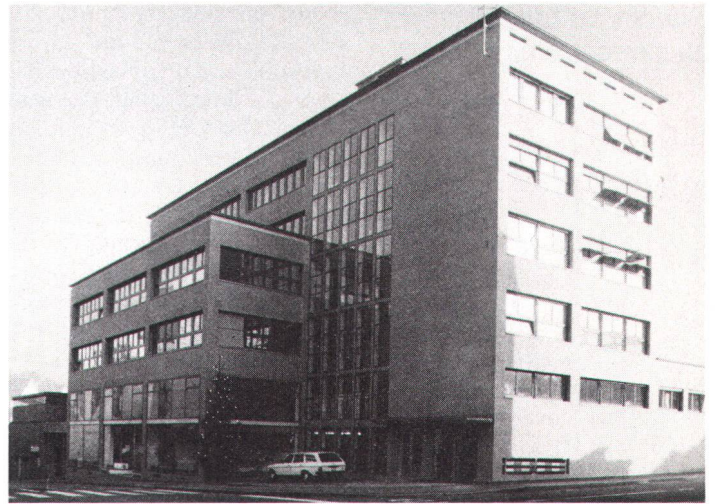
Das renovierte Verwaltungs- und Werkgebäude der Städtischen Werke Baden (Bild Eppler, Maraini & Partner) Le bâtiment administratif et pour ateliers rénové par les Travaux publics de Baden.